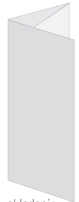
składanie na 3 do środka